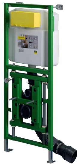
Viega Eco Plus-WC-element model 8161.22, artikel 708 764